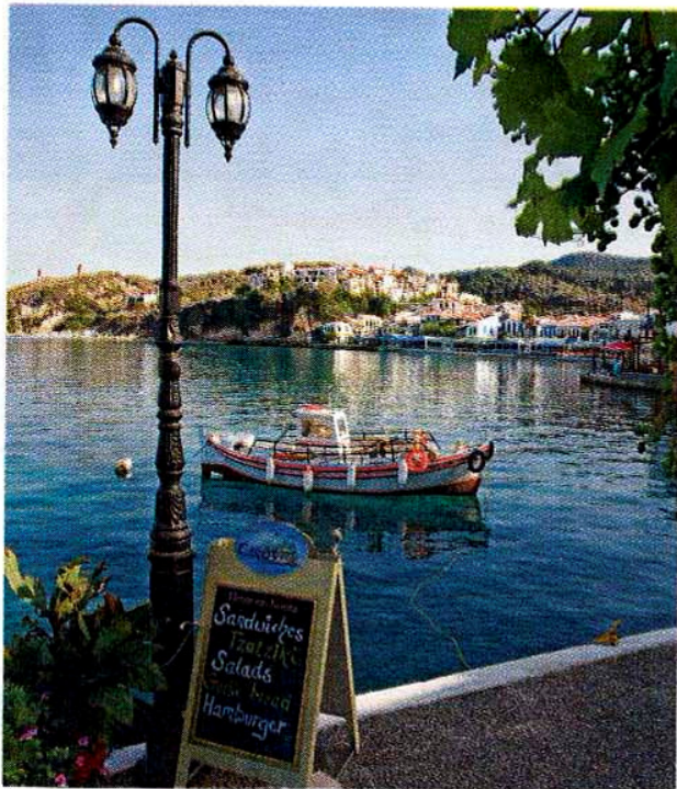
Der er lidt tomt på Kokkari havnefront midt på dagen, men om aftenen fyldes stolene op med turister, som nyder havudsigten, gerne med en ouzo.