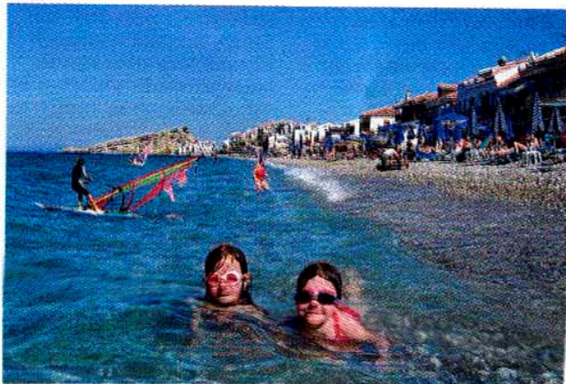
Kokkari har fine badestrande både på øst- og vestsiden. Når vinden er svag, har windsurferne svært ved at få brættet på ret køl.