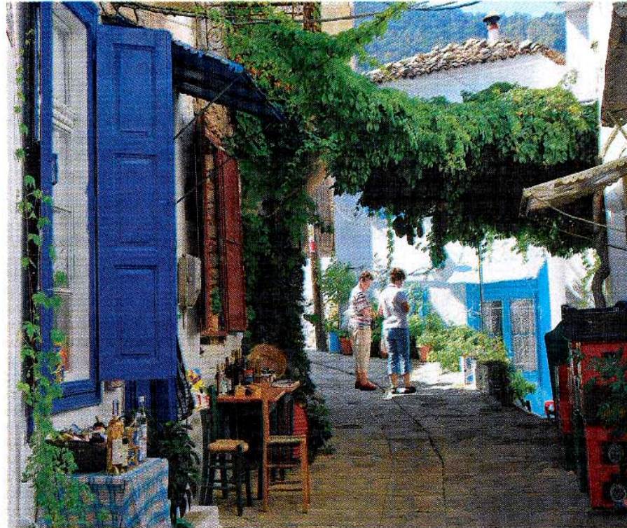
I kunstnerbyen Manolates er der grønne lunde overalt, og uden for husene er specialiteter som f.eks. hvidvinen Samos Nectar sat til salg.

Sidst på eftermiddagen vågner byens mange taverner og restauranter op til dåd, og fra de mange tændte grills i køkkenerne bliver smagssanserne bombarderet med dufte af stegt fisk, bøf, lam og fjerkræ. De karakteristiske græske krydderier oregano og basilikum tilsat hvidløg sætter prikken over i'et, og en veritabel folke-