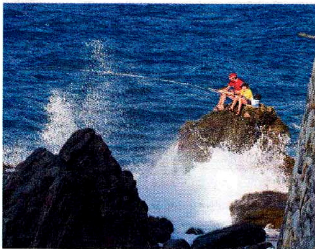
Lystfiskerne, som har fundet en god plads på klipperne nogle kilometer fra Kokkari, slipper ikke for at blive våde.